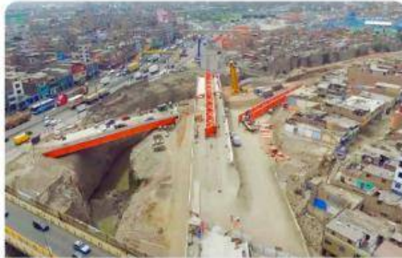
Viaductos Línea Amarilla